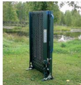
ANODIZADO EN COLOR NEGRO.

¿Otra superficie? ¿Otra anchura? ¿Otra longitud?