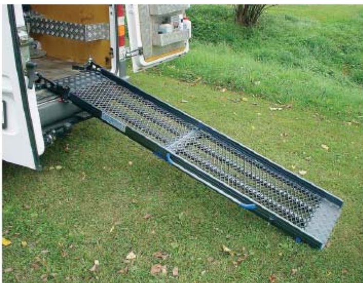
RAMPA ESTRECHA, POR EJEMPLO, PARA MOTOS O CARRETILLAS.