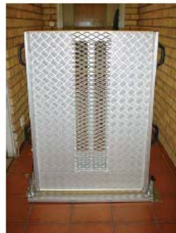
MONORAMPA: CHAPA LAGRIMADA. CARRIL PARA CAMINAR: CHAPA DE ROMBOS.