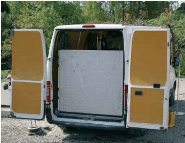
ANCHURA ESPECIAL, HECHA DE CHAPA LAGRIMADA.

¿Otra superficie? ¿Otra anchura? ¿Otra longitud?