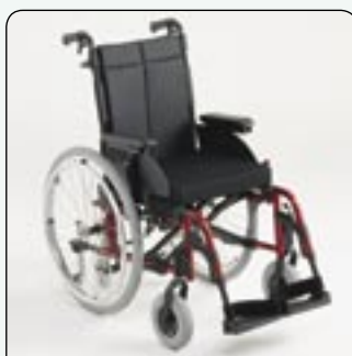
Kit de ruedas manuales (opcional) Para un uso como silla manual ligera.