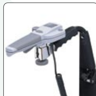
Doble mando intuitivo Reacciona según la presión ejercida en el mando.