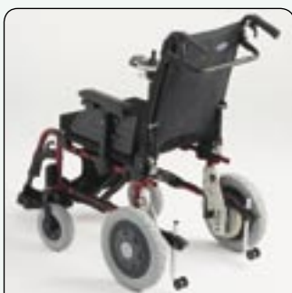
Respaldo reclinable por pistón de gas (opcional) Para una reclinación aun más fácil.